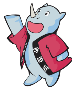
学研災キャラクター サイちゃん